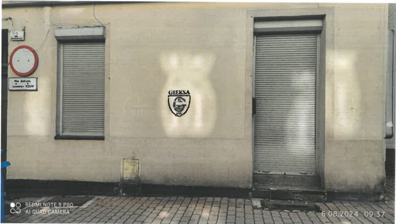
Sienkiewicza 2 Lokal użytkowy